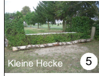
Kleine Hecke 5