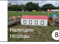
Hartmann Holzbau 8