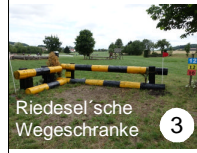
Riedesel'sche Wegeschränke 3