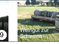
Weingut zur Schwane 10