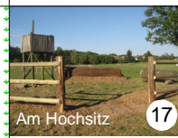
Am Hochsitz 17