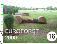
EUROFORST 2000 16