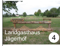
Landgasthaus Jägerhof 4