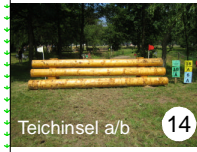
Teichinsel a/b 14