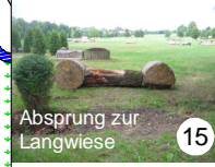
Ab sprung zur Langwiese 15