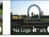
"Na Logo" a/b 9