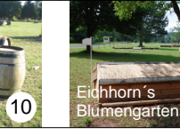
Eidhorn's Blümgarten 11