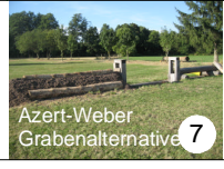
Azert-Weber Grabenalternative 7