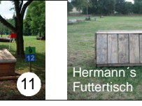
Hermann's Futtertisch 12