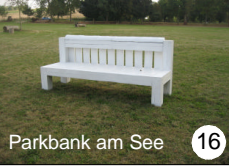
16 Parkbank am See