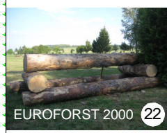
22 EUROFORST 2000