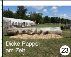
23 Dicke Pappel am Zelt