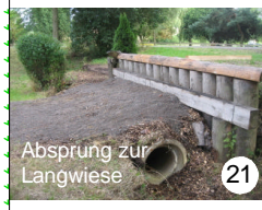
21 Absprung zur Langwiese