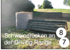
8 Schweinertücken an der Driving Range