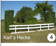
4 Karl's Hecke