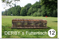
12 DERBY's Futtertisch