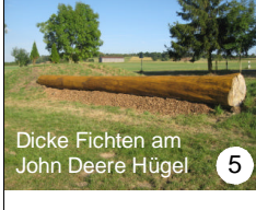
5 Dicke Fichten am John Deere Hügel