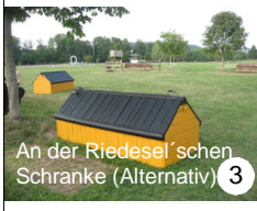
3 An der Riedesel'schen Schranke (Alternativ)