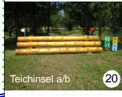
20 Teichinsel a/b