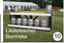
10 Lauterbacher Biertheke