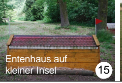
15 Entenhaus auf kleiner Insel