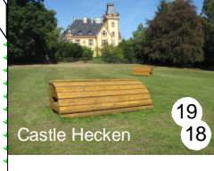
19 Castle Hecken