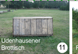
Udenhausener Brottisch 11