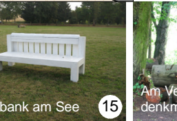
Parkbank am See 15