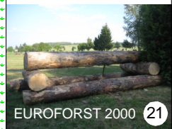
EUROFORST 2000 21