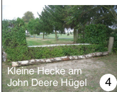
Kleine Hecke am John Deere Hügel 4