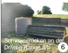
Schweinerücken an der Driving Range a/b 6