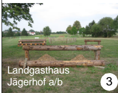
Landgasthaus Jägerhof a/b 3