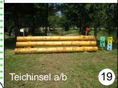
Teichinsel a/b 19