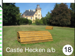
Castle Hecken a/b 18