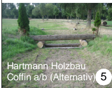
Hartmann Holzbau Coffin a/b (Alternativ) 5