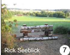
Rick Seeblick 7