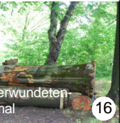
Am Verwundeten denkmal 16