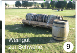
Weingut zur Schwane 9