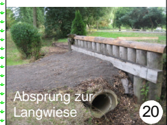
Ab sprung zur Langwiese 20