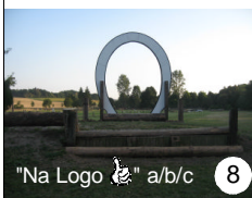
"Na Logo" a/b/c 8