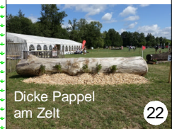
Dicke Pappel am Zelt 22