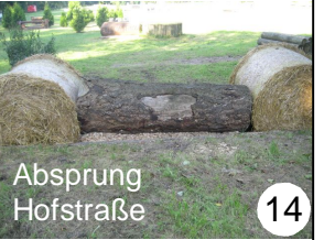
Ab sprung Hofstraße