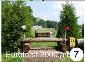
Euroforst 2000 a/b