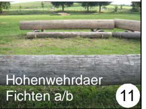
Hohenwehrdaer Fichten a/b