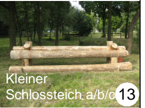
Kleiner Schlossteich a/b/c