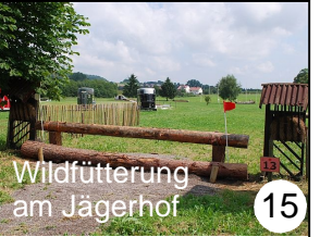
Wildfütterung am Jägerhof